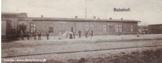
Domowce w Kruszwicy z przełomu XIX i XX wieków