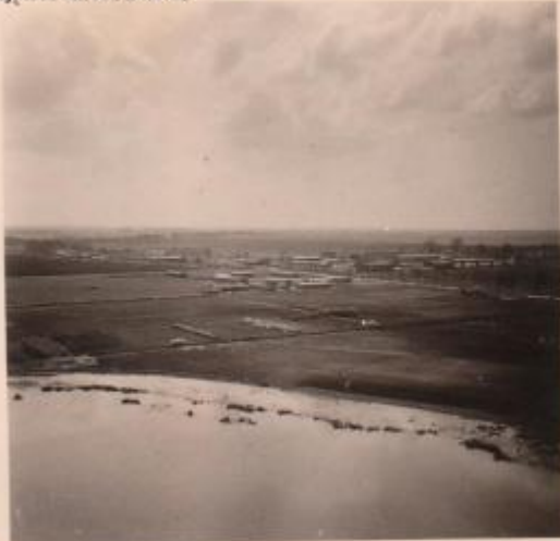
Zdjęcia z okresu 1940-41