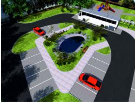
finansowane przez Unię Europejską ze środków Europejskiego Funduszu Rozwoju Regionalnego w ramach Regionalnego Programu Operacyjnego Województwa Lubelskiego na lata 2014-2020 w ramach projektu pn. Przebudowa 2 - rekreacyjnych w Chelmnie i Polanowicach.