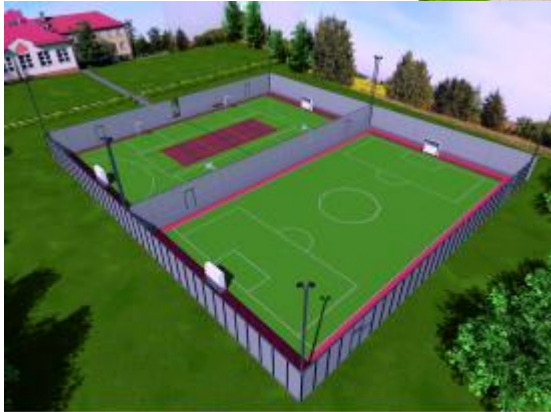
finansowane przez Unię Europejską ze środków Europejskiego Funduszu Rozwoju Regionalnego w ramach Regionalnego Programu Operacyjnego Województwa Kujawsko-Pomorskiego na lata 2014-2020 w ramach projektu pn. Przebudowa 2 - rekreacyjnych w Chelmnie i Polanowicach.