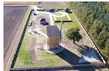
wiatrak w Chrośnie