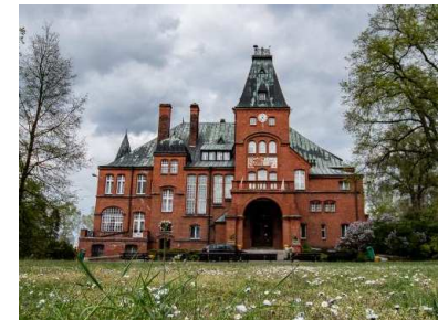
Pałac w Kobylnikach