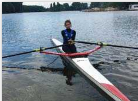
Klub Wioślarski Gopło Kruszwica reprezentowali:

W regatach startowali czołowi wioślarze w kategorii młodzika, juniora młodszego oraz juniora.